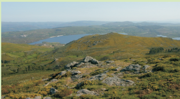
Vista sobre o encoro do Salas