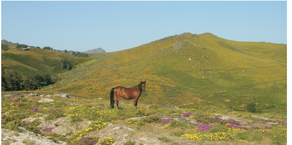
Serra do Pisco