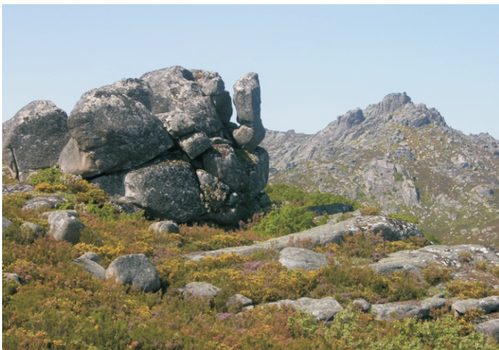
As Gralleiras desde Portela de Pitões