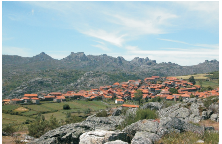
Pitões das Júnias co Xurés ao fondo