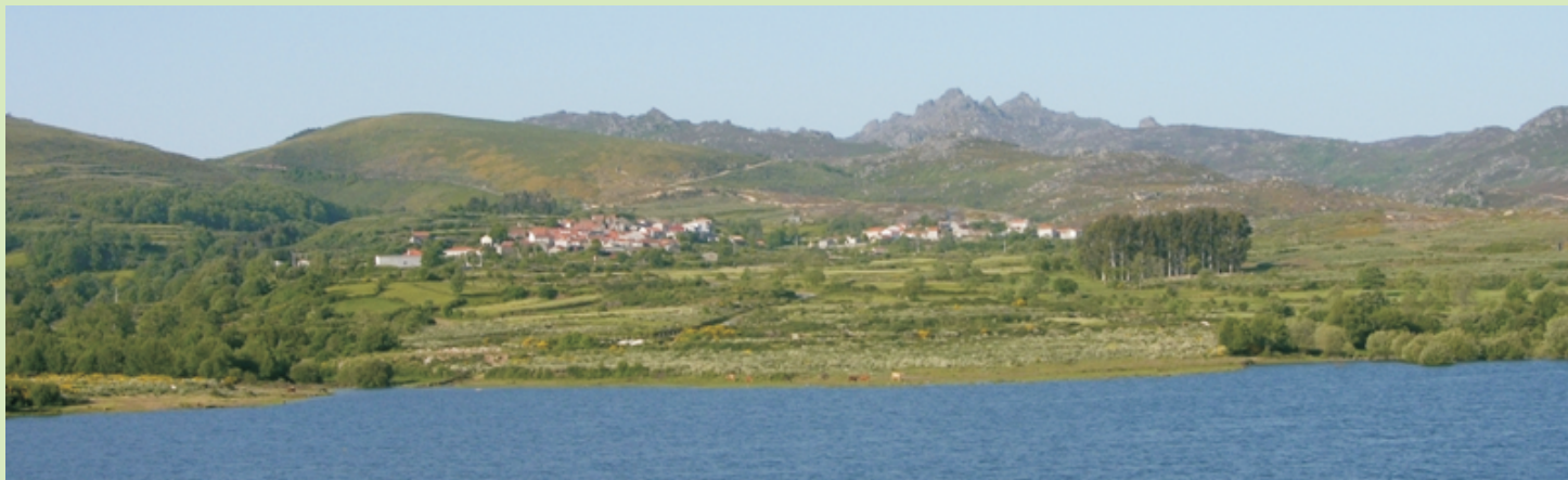
Serra do Xurés (As Gralleiras desde o encoro do Salas)