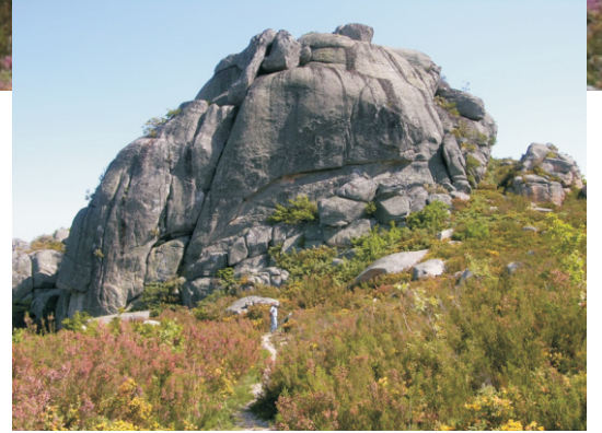
Formacións graníticas na Serra do Xurés